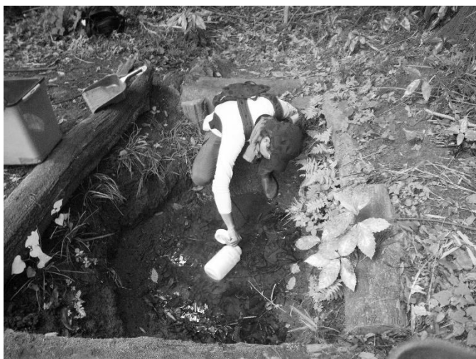
写真 1 採水風景